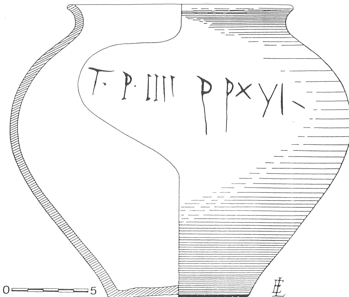
FIG. 1. – Urne gallo-romaine avec graffiti

Il s'agit d'une urne en terra nigra. Elle était brisée mais pratiquement entière, de forme très pansue, à lèvre plutôt fine et courbe, en pâte grise à noyau plus foncé avec traces de mica, extérieur mat à engobe noir.