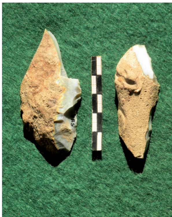
FIG. 2 – Burins paléolithiques, Les Bruyères.

Dans cette série, on note tout particulièrement la présence d'un burin bec de flûte et d'un burin dièdre double (fig. 2). À ceux-ci, s'ajoutent deux armatures tranchantes de